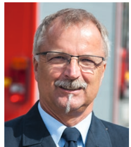
Jörg Schallhorn, Landesbranddirektor, Niedersächsisches Ministerium für Inneres und Sport

Erste Lehren können aber dennoch schon jetzt gezogen werden. Das Katastrophenschutz-Zentrallager und die zentralen Landes-Katastrophenschutzeinheiten haben sich bewährt und müssen für die Zukunft weiter ausgebaut werden. Das Niedersächsische Katastrophenschutz-Gesetz muss für die neuen Herausforderungen, z. B. durch neue gesetzliche Regelungen für den Katastrophenvoralarm oder das außergewöhnliche Ereignis, angepasst werden. Wir haben den Evaluierungsprozess bereits angestoßen und werden im Landesbeirat „Katastrophenschutz“ die gemeinsam gesammelten Erfahrungen auswerten und notwendige Anpassungen initiieren. Für die Feuerwehren werden sich daraus allgemeingültige Hinweise für die Aufrechterhaltung der Einsatzfähigkeit, den allgemeinen Dienstbetrieb und den Ausbildungs- und Übungsdienst ergeben.