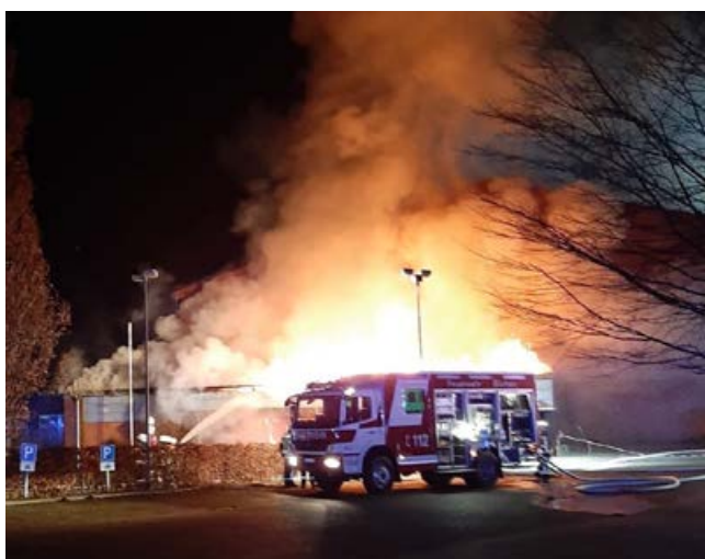
Dramatische Lage beim Eintreffen an der brennenden Sporthalle in Büchen.

Am 18. Dezember gegen 23:00 Uhr wurde auf dem Gelände der Grund- und Gemeinschaftsschule in Büchen ein Feuer in der dortigen Turnhalle gemeldet. Die zuerst eingetroffene Feuerwehr Büchen erhöhte rasch auf das Einsatzstichwort: „FEU2“.