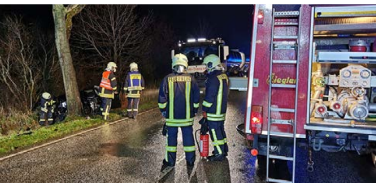
Glimpflich ging ein schwerer VU bei Fockbek ab.

Am späten Sonnabend (2. Januar) kam es auf der B203 Höhe Ernsttal zu einem Verkehrsunfall. Ein 22-jähriger Mann ist aus bisher unbekannter Ursache gegen einen Baum gefahren.