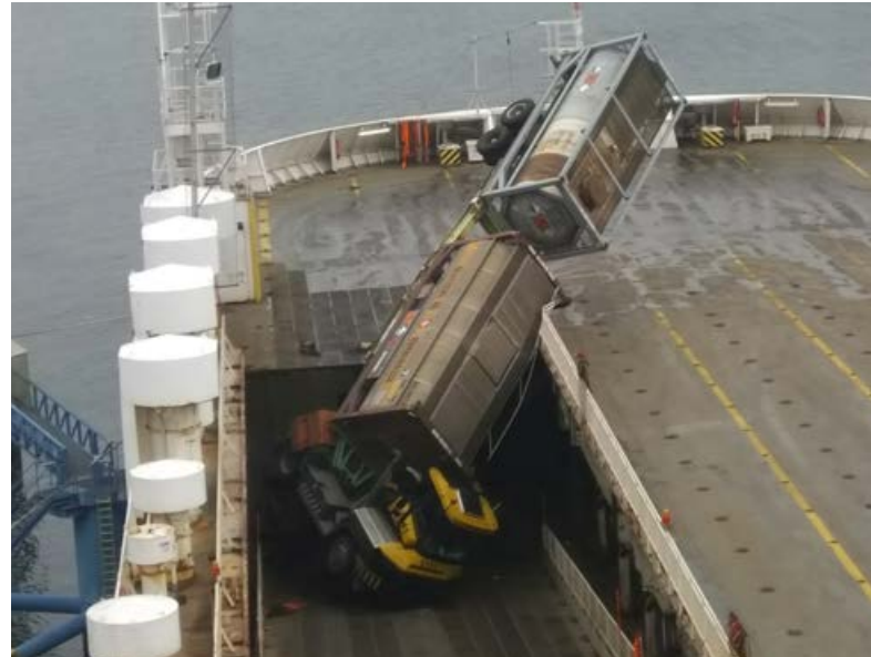
Spektakulär zeigte sich die Lage auf einer Ro Ro-Fähre am Skandinavienkai Travemünde.