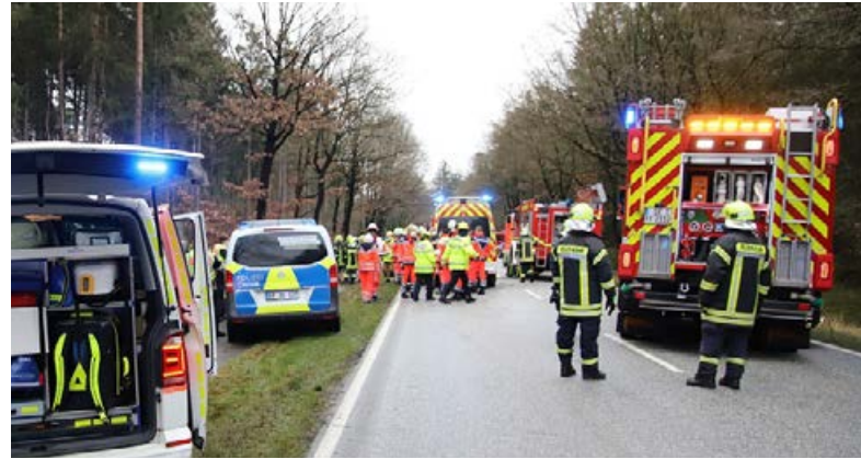
Ein Großaufgebot an Rettern wurde auf die B206 alarmiert.

Die Polizei hat noch an der Unfallstelle mit einem Sachverständigen