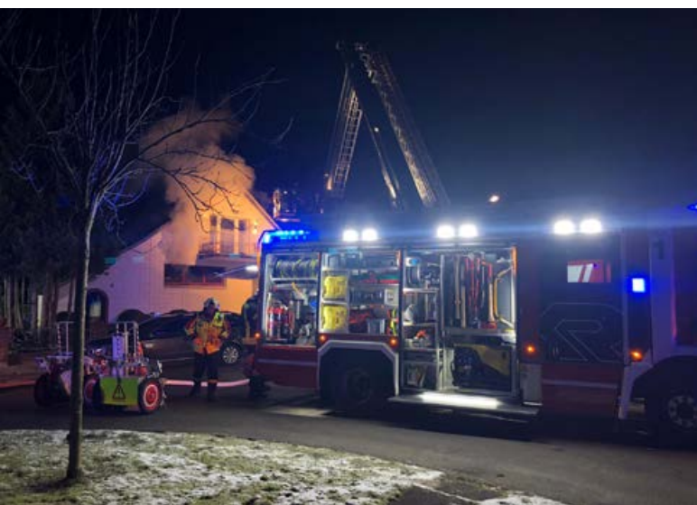
Sonntäglicher Großeinsatz in Scharbeutz.

Am Sonntag gegen 17:20 Uhr wurde der Integrierten Leitstelle Süd in Bad Oldesloe ein Vollbrand im Erdgeschoss eines Einfamilienhauses in Scharbeutz gemeldet und somit wurde Großalarm für die Feuerwehr Scharbeutz ausgelöst.