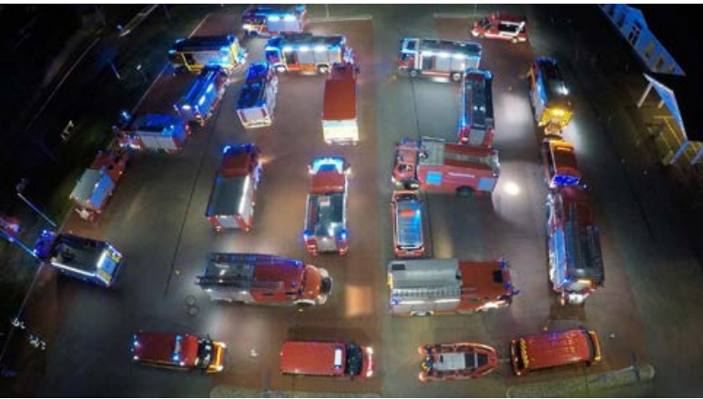
Mit Feuerwehrfahrzeugen wurde 2021 gemalt.

Einer Idee und Einladung vom Gemeindeführer Jan Koblitz der Feuerwehr Großenbrode folgten am 30. Dezember insgesamt 14 Feuerwehren aus dem nördlichen Ostholstein von Hansühn bis Puttgarden.