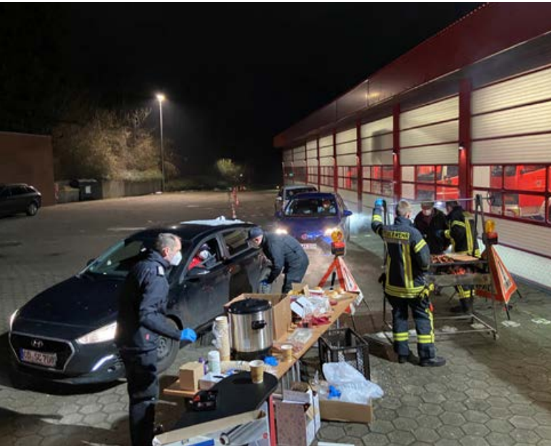
Witzige Idee zum Jubiläum - Drive In an der Feuerwache Ahrensburg.

Weil das jährliche Jubiläumsfest der Freiwilligen Feuerwehr Ahrensburg in diesem Jahr den coronabedingten Kontaktbeschränkungen zum Opfer fiel, hat der Vorstand der FF Ahrensburg die Kameradinnen und Kameraden am 9. Januar mit einer außergewöhnlichen Aktion überrascht: Leckere Würstchen vom Grill und Heißgetränke im Drive-in-Grill auf dem Gelände der Feuerwache am Weinberg serviert.