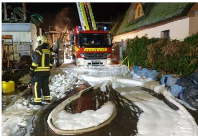
Bei diesem Brand in Aumühle war die Lageerkundung durch bauliche Gegebenheiten erst schwierig.

Neben dem Bauhof waren auf demselben Gelände die Polizei, das Wasserwerk und die Feuerwehr selbst ansässig. Die Anfahrt der Kameraden dauerte daher nur Sekunden, reichte aber aus um inzwischen offene Flammen sichtbar werden zu lassen. Das Brandobjekt selbst war sehr unübersichtlich. Zudem grenzten in unmittelbarer Nähe weitere Einzelhäuser an das Gebäude. Eines war Reet gedeckt und bei einem anderen hat bereits die Carport-Rückseite gebrannt. Fensterscheiben hatten durch die enorme Hitze Risse bekommen. Es bestand zudem anfangs die Möglichkeit, dass sich noch Personen in dem Gebäude befanden. Dies und eine Ausbreitung auf Nachbargebäude zu verhindern waren anfangs die Einsatzschwerpunkte.