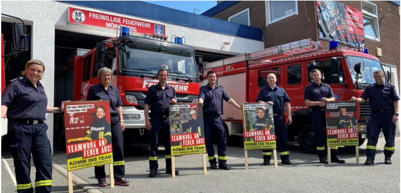
Die FF Mönkeberg präsentiert eine eigene neue Werbekampagne.

Die neue Werbekampagne wurde durch die Initiative von zwei Kameradinnen ins Leben gerufen. Sie sammelten Ideen und stellten diese mit Hilfe einer Power Point-Präsentation der schon bestehenden Werbegruppe vor.