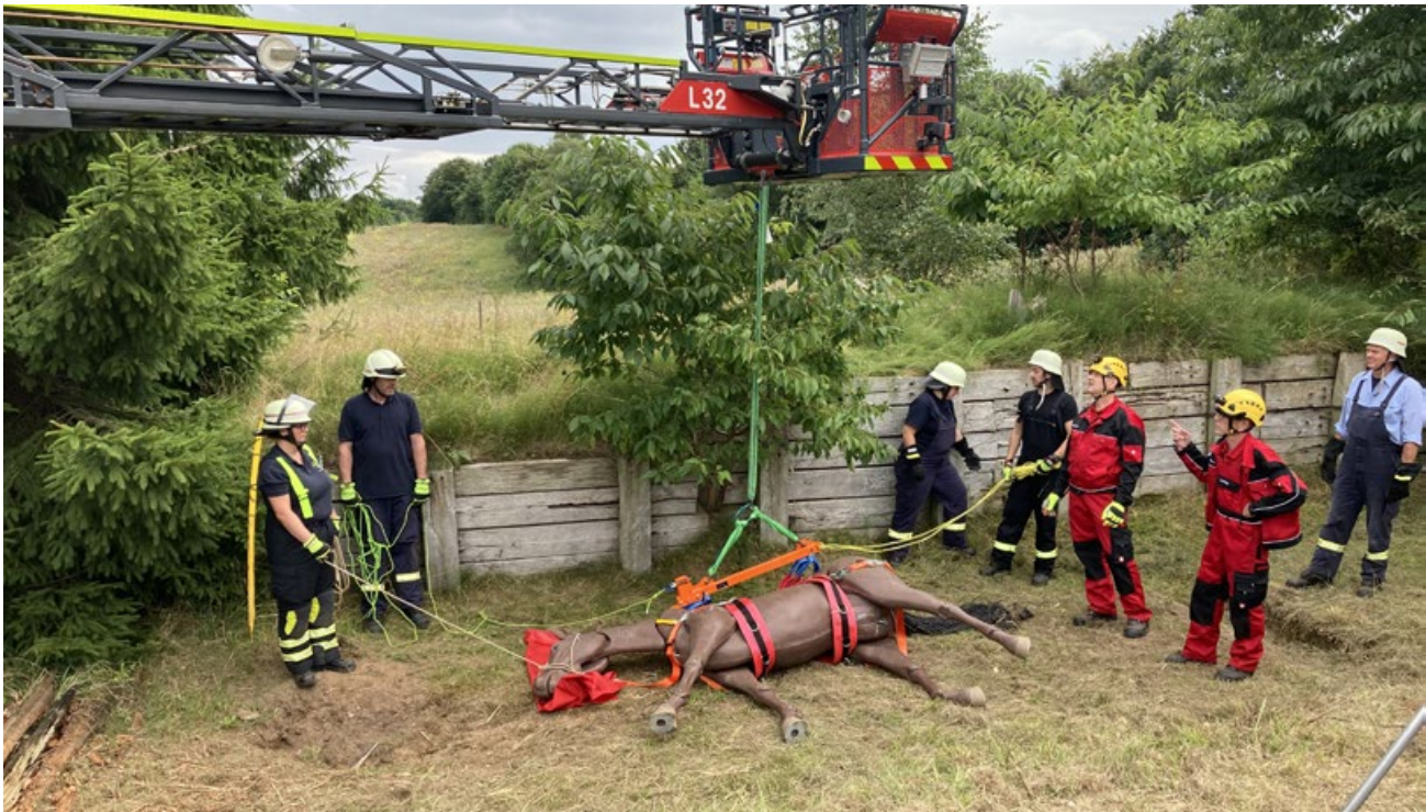
Einen ganzen Tag lang übte man im Amt Bordesholm die Großtierrettung.

Einsätze mit Großtieren wie zum Beispiel Pferden oder Rindern stellen für die Feuerwehr eine große Herausforderung dar, die bedingt durch das hohe Gewicht der Tiere und die durch den Fluchtinstinkt schwer vorhersehbaren Reaktionen mit erheblichen Gefährdungen für die Einsatzkräfte einhergehen.