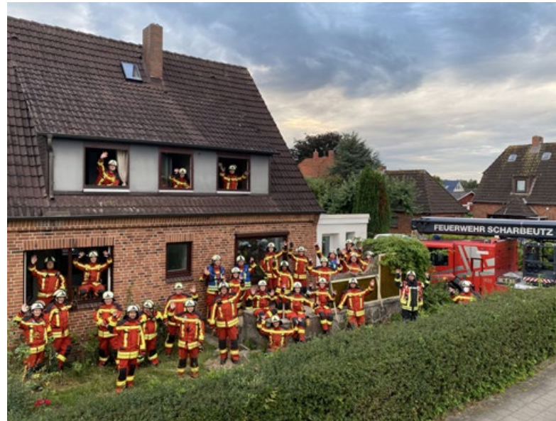
Eine seltene Gelegenheit für besondere Übungen hatte die FF Scharbeutz in einem Abbruchhaus.