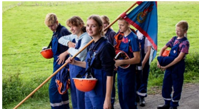
Im Kreis Stormarn konnten die Jugendfeuerwehren wieder eine Rallye durchführen.