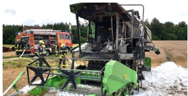
Dieser Mähdrescher brannte in Negenharrie.

Am Freitagabend gegen 22:30 Uhr wurde die FF Flintbek zu einem Unfall auf der Landesstraße 318 gerufen. Ein Golf Cabrio war unter den Anhänger eines landwirtschaftlichen Gespannes geprallt und eingeklemmt. Die Helfer und der eingesetzte Notarzt versuchten den Fahrer zu reanimieren. Die Wiederbelebung blieb leider erfolglos, der Mann verstarb noch an der Unfallstelle. Die Beifahrerin wurde mit hydraulischem Rettungsgerät aus dem Wrack befreit und kam in ein Krankenhaus. Der Fahrer des Schleppers blieb unverletzt. Die Arbeiten gestalteten sich schwierig, da das Cabrio unter dem mit Getreide voll beladenen Anhänger verkeilt war. Ein Sachverständiger wurde zum Unfallort gerufen, um die Ursache des schweren Unfalls zu klären.