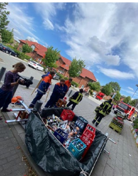
Pfandsammeln in Flensburg.

Durch die Unwetter im Westen und im Süden Deutschlands sind sechs Feuerwehrleute im Einsatz gestorben. Andere Feuerwehrleute haben beim Einsatz durch die Flut all ihr Hab und Gut verloren. Die Feuerwehr Flensburg-Jürgensby und der Förderverein der Jugendfeuerwehr Flensburg-Jürgensby e. V. wollten Solidarität zeigen und durch Ihren Einsatz den Opfern bzw. Hinterbliebenen der Feuerwehren helfen.