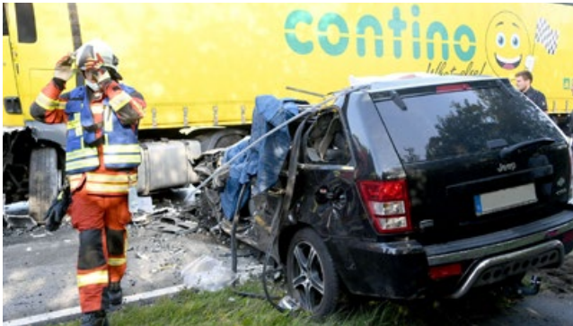
Ein Todesopfer musste die FF Nortorf aus diesem Wrack bergen.

Das vergangene Wochenende war im Kreisfeuerwehrverband Rendsburg-Eckernförde geprägt von einigen dramatischen Einsätzen. So kamen bei zwei Verkehrsunfällen in Nortorf und Flintbek zwei Menschen ums Leben.