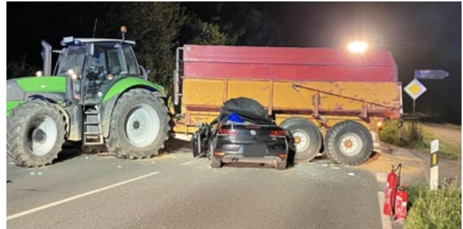
Schwerer Einsatz für die FF Flintbek bei der Bergung des tödlich verunglückten Autofahrers.

frühen Freitagnachmittag hin. Eingesetzt waren die FF'n Achterwehr, Melsdorf, Felde, Bredenbek und Krummwich.