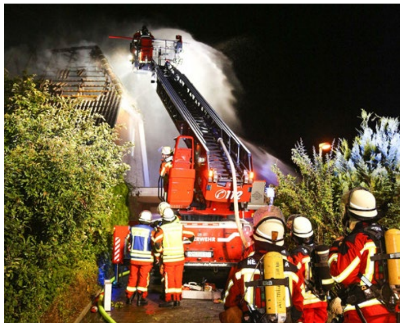
Ein ausgedehnter Dachstuhlbrand forderte die Feuerwehren in Neumünster.

Die Betreuungskomponente vom DRK wurde zudem mit alarmiert, um die Einsatzkräfte mit Getränken und kleinen Snacks während des Einsatzes zu versorgen, da sich der Einsatz bis in die frühen Morgenstunden hinzog. Die beiden Hausbewohner konnten sich selbständig ins Freie retten und blieben unverletzt. Rund 70 Einsatzkräfte waren vor Ort. Die Kriminalpolizei hat die Brandstelle beschlagnahmt. Wie hoch der Sachschaden ist, kann nicht beziffert werden. Das Objekt ist nicht bewohnbar, die Eigentümer kamen bei Nachbarn unter.