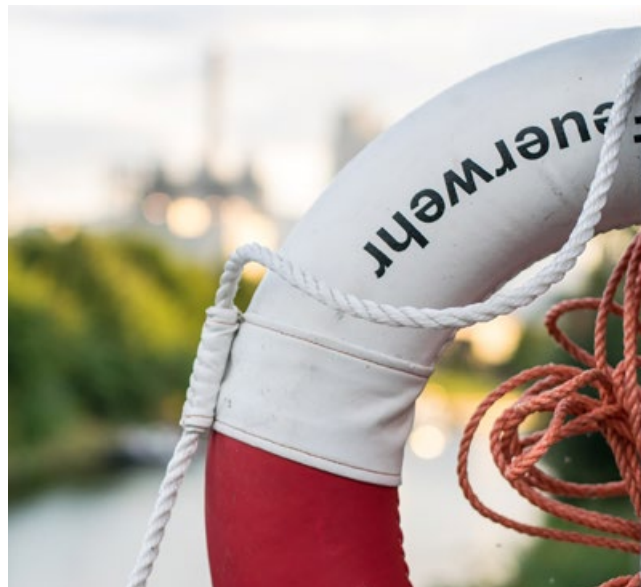
Feuerwehren helfen Feuerwehren.

Die ersten Angebote wurden bereits eingestellt und wir haben aus beiden betroffenen Bundesländern bereits eine positive Rückmeldung erhalten, dass sie sich über die Aktion freuen und den Feuerwehren im Norden danken.