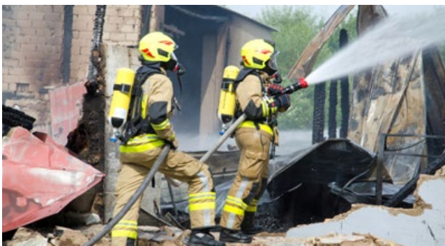
In Achterwehr brannte eine Scheune nieder.

Aus noch ungeklärter Ursache ist am Freitagmorgen (13.08.2021) der Fahrer eines Jeeps auf der Hauptstraße (L48) von Eisendorf in Richtung Alt-Mühlendorf in Höhe des Kieswerkes von seiner Fahrbahn abgekommen und frontal in einen entgegenkommenden Sattelzug geprallt. Für den Fahrer des Geländewagens kam jede Hilfe zu spät, er war bereits beim Eintreffen der Rettungskräfte verstorben. Der Fahrer des Lastwagens war in dem Fahrerhaus eingeklemmt. Der per Hubschrauber eingetroffene Notarzt übernahm die Versorgung, während die Feuerwehr Nortorf den Mann befreite. Nach erster Erkenntnis wurde er bei dem Zusammenprall aber nicht schwer verletzt. Neben der FF Nortorf war auch die FF Eisendorf eingesetzt. Ebenfalls am Freitagvormittag kam es zu einem Großbrand in Achterwehr. Eine 20x10 Meter große Scheune stand in Vollbrand. Bei