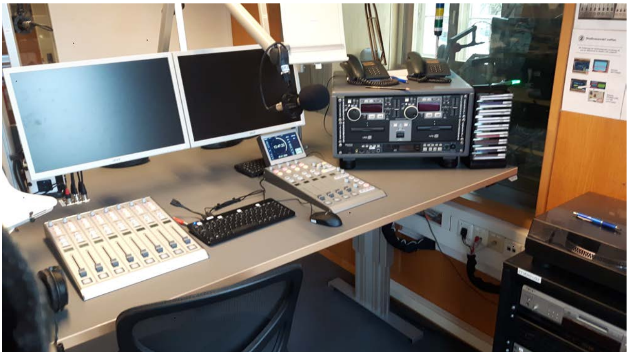
Digitales Sendestudio Lüneburg