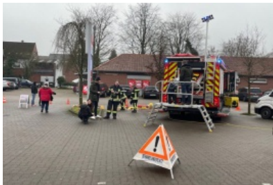
Tag des Notrufes: Vereine und Hilfsorganisationen stellen sich vor