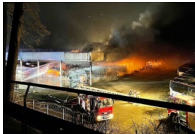
Großfeuer in Sittensen: 20 Busse in Flammen