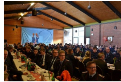
Kreisjugendfeuerwehrtag in Spreckens