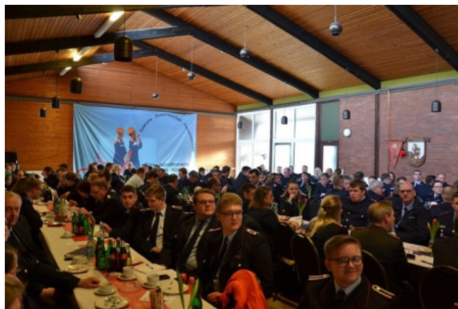
140 Mitglieder aus 47 Jugendfeuerwehren nahmen am diesjährigen Kreisjugendfeuerwehrtag in Spreckens teil, der aus Anlass des 5-jährigen Bestehens der Kinderfeuerwehr Spreckens-Minstedt stattfand.