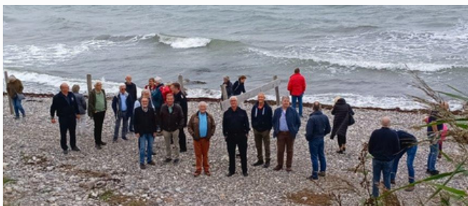
Die „Ehemaligen“ auf Fehmarn.

Das Projekt bot für die Gemeinschaft der Ehemaligen des Landesfeuerwehrverbandes Schleswig-Holstein den Anlass, sich Nordeuropas größtes Infrastrukturprojekt einmal aus der Nähe anzusehen. Die Freiwillige Feuerwehr Burg auf Fehmarn hatte ein sehr interessantes Programm für die Gäste ausgearbeitet. Dazu zählten beispielsweise Ausführungen seitens der Feuerwehr-Führungskräfte über die, zum normalen Einsatzgeschehen hinaus, ehrenamtlich und zahlreich zu leistenden Gesprächseinheiten bezüglich der Sicherheit und des Notfallmanagements. Im Aufbau befindet sich eine hauptamtlich besetzte Feuerwehreinheit.