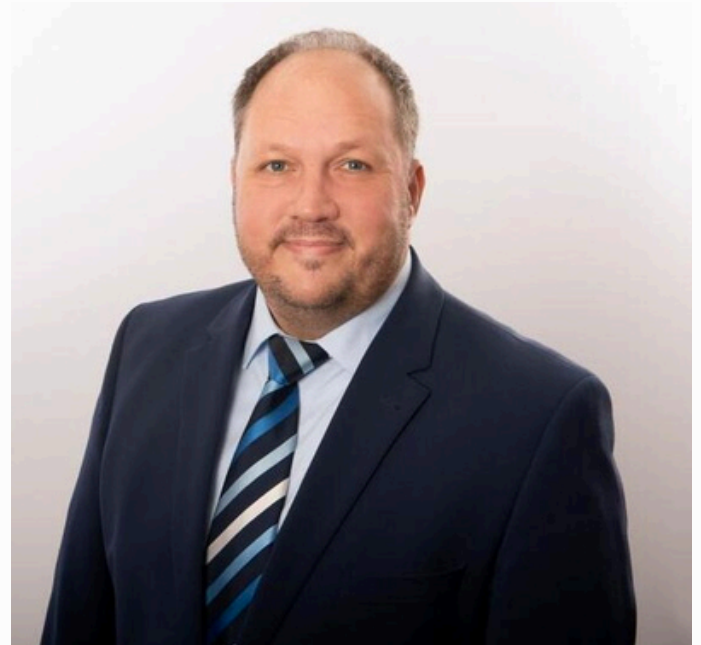
Ostholsteins Landrat Timo Gaarz vertritt die Kreise im Landesfeuerwehrverband.

Die Landesfeuerwehrversammlung ist das höchste Gremium des Landesfeuerwehrverbandes Schleswig-Holstein und spielt eine entscheidende Rolle bei der Gestaltung und Weiterentwicklung des Feuerwehrwesens im Land.