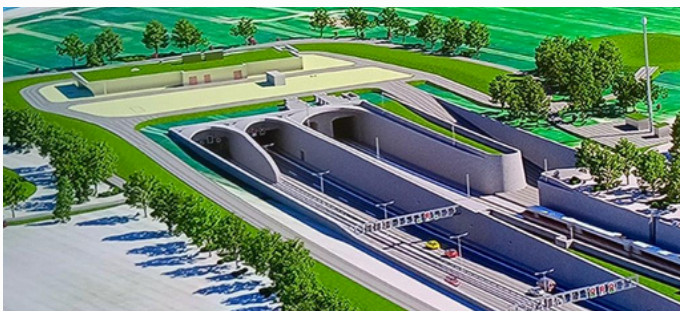
So soll der Tunnel aussehen. Grafik: A/S Fehmarn

Der Bau des Ostseetunnels zwischen Deutschland und Dänemark schreitet unaufhörlich voran. Die Baustelle des Tunnels der zukünftigen Festen Fehmarnbeltquerung ist ein deutsch-dänisches und für den gesamten europäischen Wirtschaftsraum wichtiges Infrastruktur-Projekt. Sehr interessante, detaillierte Vorträge gab es für die Feuerwehr-Gäste im Informationszentrum in Burg auf Fehmarn sowie auf den Baustellen.